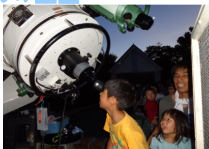
星をみる会の様子