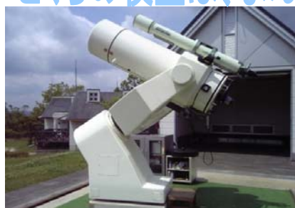
県下最大の反射式望遠鏡 (口径51センチ)