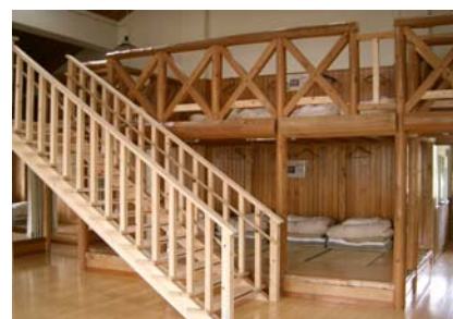
宿泊して、思いっきり楽しもう！

年間開催日 ※ 荒天の場合は、室内で「星の話」や「星座早見盤講座」等を行います。