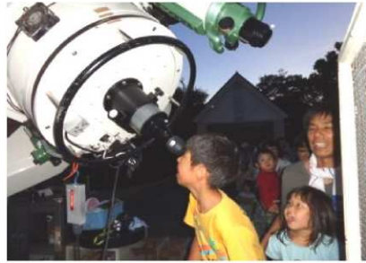
星をみる会の様子