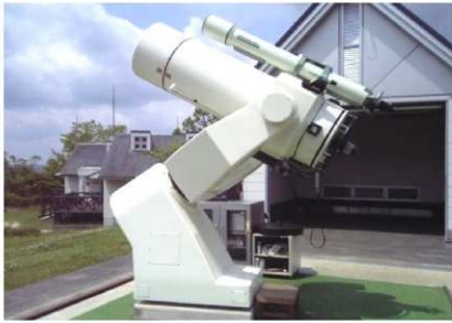
県下最大の反射式望遠鏡（口径51センチ）