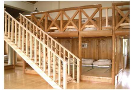
宿泊して、思いっきり楽しもう！